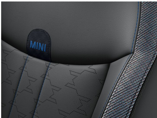
VESCIN-/STOFF KOMB. SCHWARZ/ BLAU TCB2